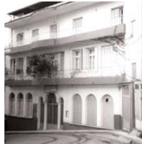
Τὸ οἰκοτροφεῖο τῶν «40 Μαρτύρων» Κοζάνης (1958-2003)

Διότι φανταστήτε· σήμερα ὑπάρχουν ἀρκετὰ οἰκοτροφεία, κέντρα χριστιανικά, τὰ ὁποῖα οἱ ἄλλοι μισοῦν θανασίμως καὶ σκέπτονται τὴν ἐξόντωσί τους. Ὁν τρόπον στὴν Ἀλβανία ὁ Χότζας τὰ ἐξόντωσε ὅλα τὰ χριστιανικά σωματεία, ὅλας τὰς κινήσεις, ὅλας τὰς ἐνορίας, δὲν ἀποκλείεται καὶ ἐδῶ νὰ συμβῆ τὸ ἴδιο. Οὔτε προφητεύω οὔτε εἶμαι μάντης κακῶν,