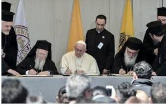
(Στην φωτογραφία υπογράφεται το λαθρο-μεταναστευτικό)

Οι εχθροί της Ορθοδοξίας και της Ελλάδος είναι και δικοί μου εχθροί!