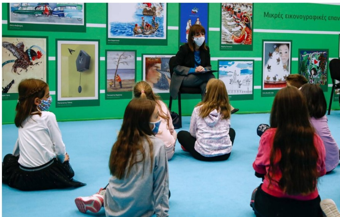
Αλγεινή εντύπωση προκάλεσαν τα λόγια της ΠτΔ σε παιδιά Δημοτικού...

«Η Πρόεδρος της Δημοκρατίας μίλησε για τον Winnie ένα αρκουδάκι από κάποιο παιδικό παραμύθι και τους είπε ότι... δεν είναι ούτε αρσενικό, ούτε θηλυκό, αλλά κάτι... άλλο. Όπως είπε αυτό είναι το αγαπημένο της παιδικό, παραμύθι καθώς ουσιαστικά προωθεί μια unisex κοινωνία χωρίς διακριτά φύλα».